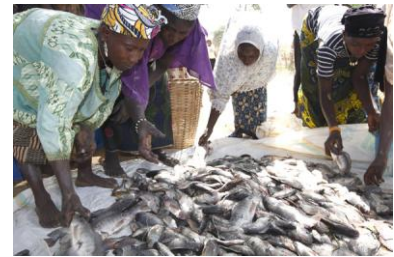
Mitglieder der Gruppe Farha begutachten den Fang des Tages.