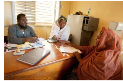
Das Komitee des Kreditverbands entscheidet über die Vergabe von Darlehen.